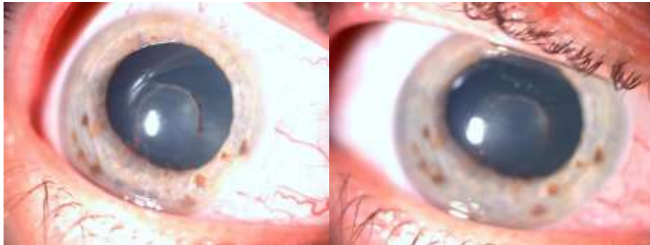
Fig. 2 - Biomicroscopia del segmento anterior del ojo derecho a la semana de tratamiento. Membrana prelental en reabsorción.

diferencia y se comenzó con prednisona oral (tabletas de 20 mg) 30 mg diarios, teniendo en cuenta sus antecedentes de diabetes a fin de disminuir al mínimo posible los efectos secundarios, con monitorización frecuente de las cifras de glicemia en sangre y de la presión arterial. La frecuencia y la dosis de los medicamentos fueron modificándose según la evolución clínica de la paciente (Fig. 2).