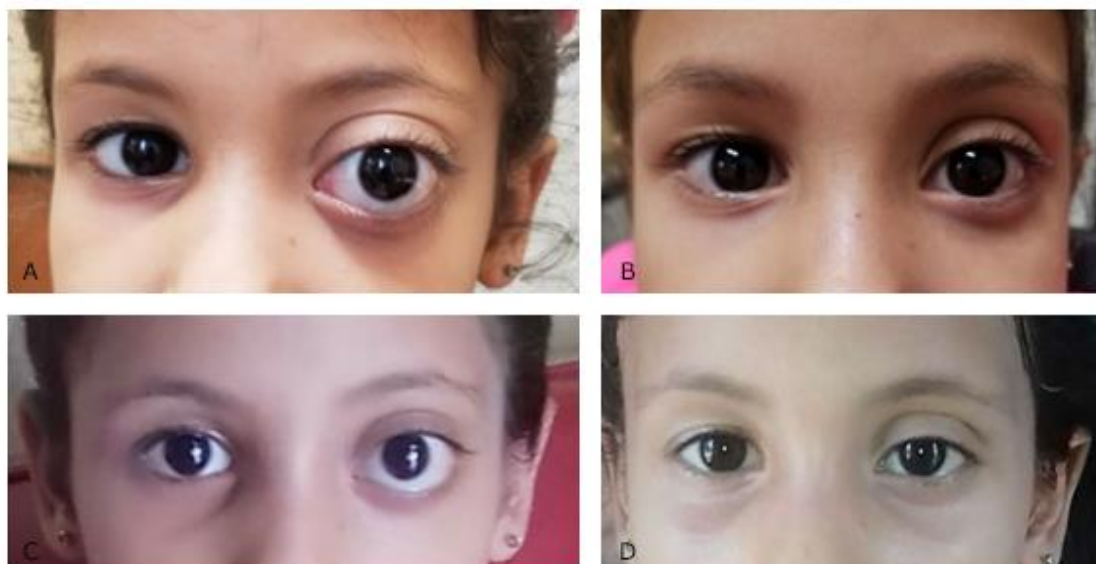
Fig. 1 – Fotografías de la paciente. A) Al diagnóstico inicial. B) Al mes de tratamiento. C) Recaída en el mes 7 (1 mes después de concluido el tratamiento). D) Al mes 8, después de realizar re-tratamiento.

Se realizó la RMI evolutiva donde se constata la mejoría imagenológica del proceso. Se observó una lesión pequeña residual, sin repercusión clínica en la paciente (figura 2), a la cual se le dará seguimiento clínico y por RMI cada 3 meses. Durante el curso del tratamiento no se reportaron reacciones adversas.